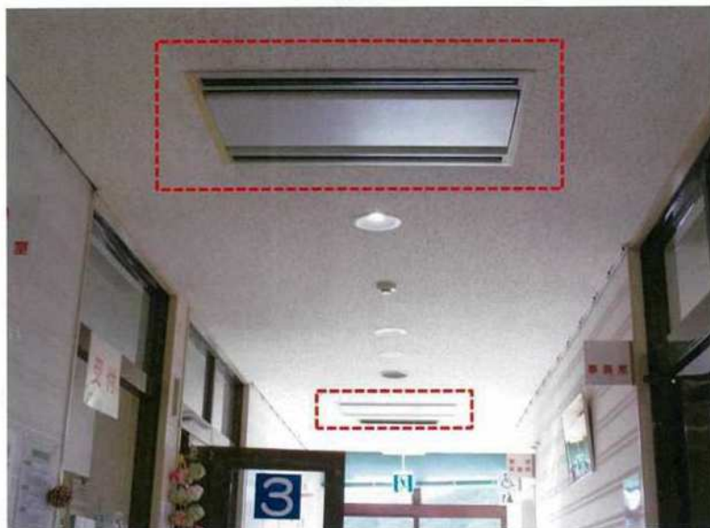
PAC3-2廊下多目的便所側 2台